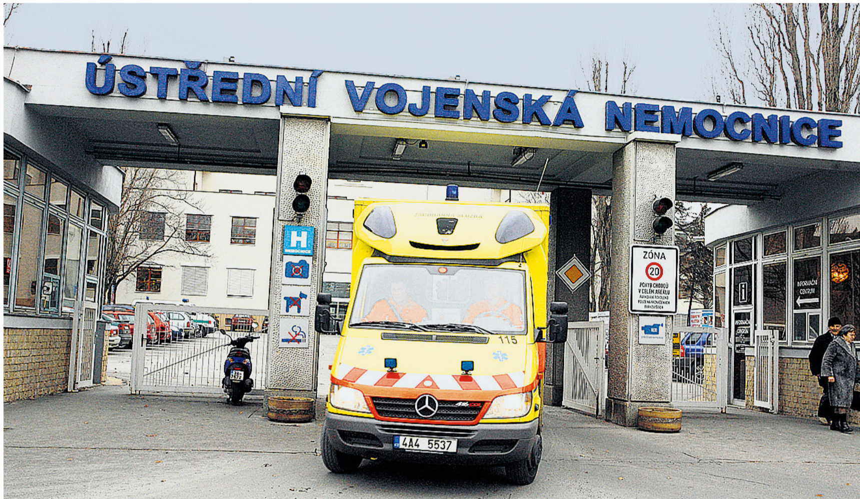
SOUČASNÝ VJEZD DO NEMOCNICE. Kromě známého vjezdu v ulici U Vojenské nemocnice vznikne podle projektu další na opačné straně v ulici Stamicově.

V rámci projektu propojujícího veřejný a soukromý sektor vyrostou v areálu stavby s komerčním využitím